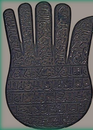
Ορειχάλκινη παλάμη με αποτροπαϊκή αραβική επιγραφή