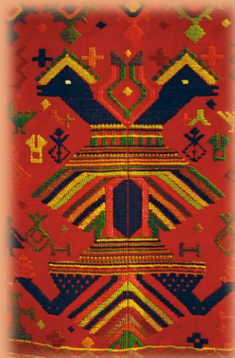
Λεπτομέρεια από υφαντή (μ)πάντα (διακοσμητικό κάλυμμα τοίχου)