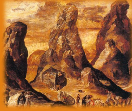
Άποψη του Όρους και της Μονής Σινά, Μεικτή τεχνική (τέμπερα και λάδι) σε ξύλο, 1570