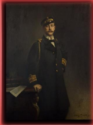
Ο πρίγκιπας Γεώργιος, έργο του Α. Troncit, 1917