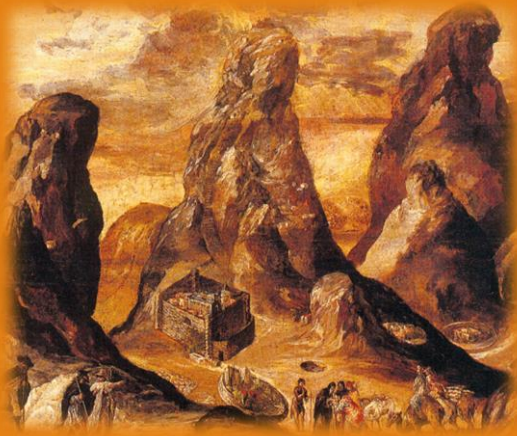
Άποψη του Όρους και της Μονής Σινά, Μεικτή τεχνική (τέμπερα και λάδι) σε ξύλο, 1570