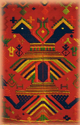
Λεπτομέρεια από υφαντή (μ)πάντα (διακοσμητικό κάλυμμα τοίχου)