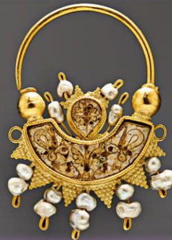
Χρυσό σκουλαρίκι διακοσμημένο με σμάλτο και μαργαριτάρια, 10ος αι.