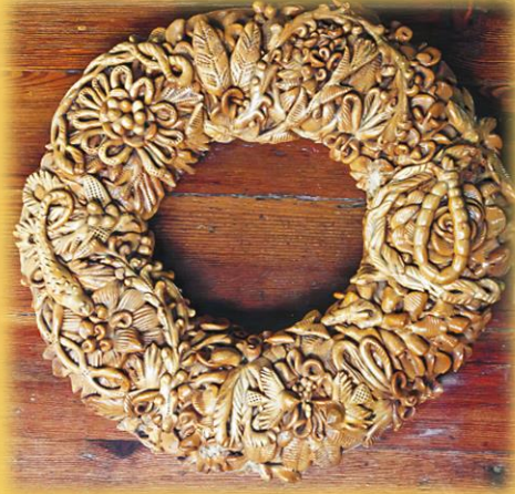
Κουλούρι του γάμου Εθνογραφική Συλλογή