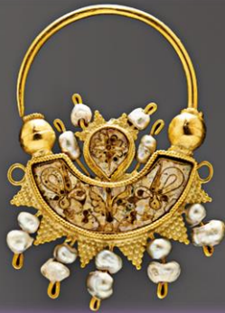
Χρυσό σκουλαρίκι διακοσμημένο με σμάλτο και μαργαριτάρια, 10ος αι.