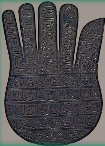
Ορειχάλκινη παλάμη με αποτροπαϊκή αραβική επιγραφή