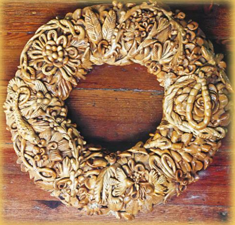
Κουλούρι του γάμου Εθνογραφική Συλλογή