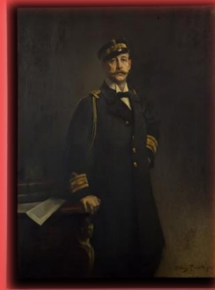
Ο πρίγκιπας Γεώργιος, έργο του Α. Troncit, 1917